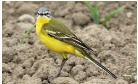
Die Bestände der hübschen Wiesenschafstelze gehen seit einigen Jahren stark zurück.

Ein trauriges Beispiel hierfür ist die Schafstelze. Noch in der Roten Liste der