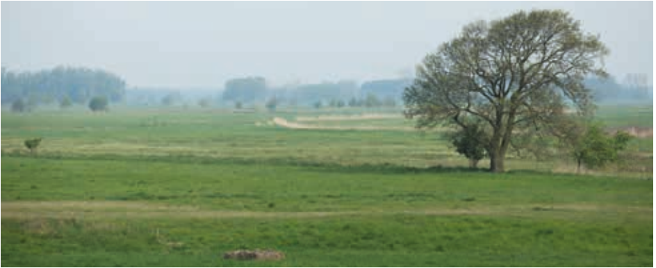
Selten geworden – idealer Lebensraum für den Mäusebussard: Ausgedehnte Grünländereien mit eingestreuten Gehölzen.

worden ist. Dies wurde bislang leider versäumt.