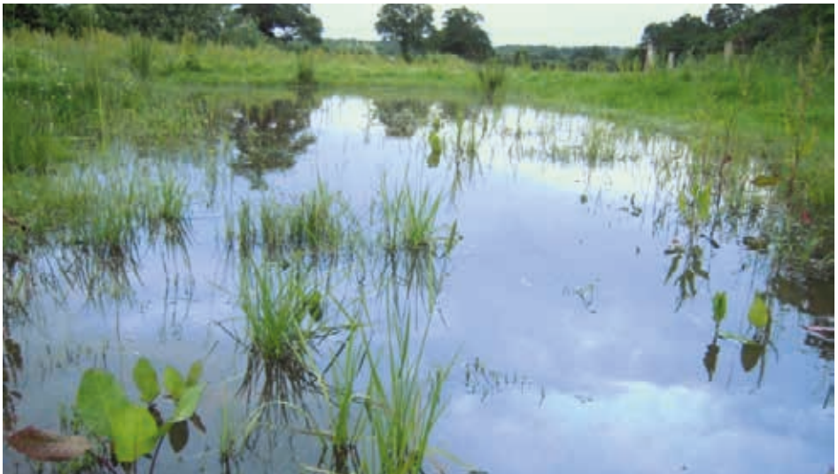
Die Ausgleichsflächen haben sich zu hochwertigen „Amphibien-Paradiesen“ entwickelt.

Darüber hinaus sollte Ihnen auch bekannt sein, dass von dem Jakobskreuzkraut für das Weidevieh keinerlei Gefährdung ausgeht, da die darin enthaltenen Giftstoffe den Verzehr durch die Tiere verhindern. Problematisch kann es allenfalls dann werden, wenn das Kraut ins Heu gelangt. Die Erzeugung von Heu ist aber auf den in Rede stehende Flächen überhaupt nicht vorgesehen und würde zudem dem Ausgleichszweck (Amphibienschutz, siehe oben!) widersprechen, da ein Mähen des Grünlandes zwangsläufig