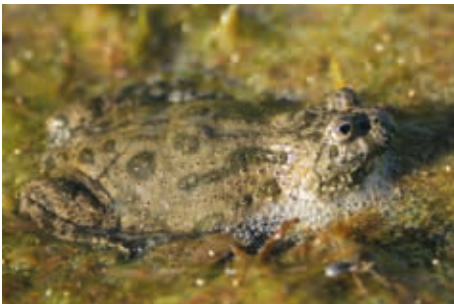
Die Rotbauchunke verbringt einen Teil ihres Lebens im Grünland. Daher gilt: Mähen ist tabu!

Zu ihrem Vorwurf, die Flächen würden zwischenzeitlich entwertet sein, ist anzumerken, dass diese - wie oben dargestellt - rechtsverbindlich ausschließlich für Naturschutzzwecke zu nutzen sind. Eine darüber hinausgehende In-Wertsetzung im Sinne einer wirtschaftlichen Betrachtung ist von daher von vornherein ausgeschlossen. Vor diesem Hintergrund haben Sie sicherlich Verständnis dafür, dass der NABU weiterhin keine Maßnahmen zur Bekämpfung des Jakobskreuzkrautes, als Charakterpflanze extensiver Weideflächen auf den Ausgleichsflächen initiieren oder durchführen wird.