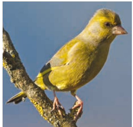
Grünfinken sind für eine letale Trichomonaden-Infektion besonders anfällig.

Nach Angaben von Veterinären besteht für Menschen, Hunde und Katzen keine Gefahr einer Infektion. Aus bisher unbekanntem Gründen scheinen auch die meisten anderen Vogelarten wesentlich weniger empfindlich auf den Erreger zu reagieren als Grünfinken.