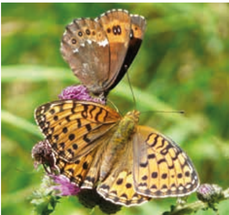
Perlmutterfalter und Mohrenfalter auf Distel.

Weißer Fangzettel – sogenannte Malaisefallen, benannt nach dem Insektenkundler René Malaise, – haben Aktive des Entomologischen Vereins Krefeld zwischen 1989 und 2014 an 88 Standorten in ganz NRW aufgestellt. Die Arten der darin gesammelten Fluginsekten wurden bestimmt und die Masse aller Tiere gewogen. Die Ergebnisse sind deprimierend. Während 1995 im Durchschnitt noch 1,6 Kilogramm aus den Untersuchungsfallen gesammelt wurden, sind es heute maximal 300 Gramm.