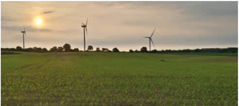
Die Idylle trägt – Die Windkraftnutzung wird zunehmend Opfer unter den Großvögeln fordern.

Dass der Bussardbestand durch den rapiden Verlust von Grünland schon seit geraumer Zeit latent gefährdet ist, ist schon länger bekannt. Ebenso die hohen Individuenverluste durch die Windkraft. Insofern hätte die Landesregierung bei der laufenden Fortschreibung der Regionalplanung zum Ausbau der Windkraftnutzung bereits vor dem Hintergrund des Vorsorgeprinzips Schutzinstrumentarien für den Mäusejäger entwickeln müssen, wie es z.B. bei anderen Großvogelarten in Form von Mindestabständen zu Brutplätzen oder dem Freihalten großräumiger Dichtezentren versucht