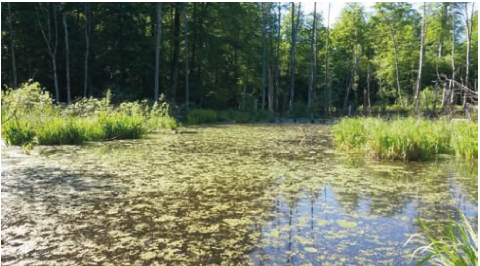
Im Wahlsdorfer Holz bei Ahrensböök lässt sich an vielen Stellen erahnen, wie Urwald sein könnte.

Nutznieser dieser vergleichsweise extensiven Bewirtschaftung gibt es viele, vor allen Dingen unter den Wirbellosen, aber auch unter den Fledermäusen, Amphibien und vor allen Dingen den Vögeln. Hier sind es neben den vielerorts schon selten gewordenen Arten wie Waldlaubsänger oder Trauerschnäpper insbesondere die Spechte, die im Wahlsdorfer Holz in bedeutenden Dichten vorkommen. Im Wahlsdorfer Holz kann man mit etwas Glück gleich vier Spechtarten beobachten: als größten und eindrucksvollsten Vertreter, den