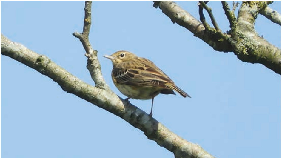
Bei bestem Wetter präsentierte ein Baumpieper den Teilnehmern der Curauer Moor-Exkursion seinen Gesang.

Am 07. Mai präsentierte sich das Curauer Moor beim angekündigten vogelkundlichen Spaziergang ganz anders. 17 Teilnehmerinnen und Teilnehmer fanden sich um 8 Uhr 30 zu allerbesten Wetter- und Beobachtungsbedingungen ein. Gleich am Anfang führte ein Baumpieper von einer Erlenspitze seinen Gesang der ganzen Gruppe in bester Sichtweite vor. Etwas weiter wurden die ersten Braunkehlchen dieses Jahres im Curauer Moor gesichtet und auch ein Neuntöter zeigte sich. Die noch vom Frühjahrsregen vorhandenen