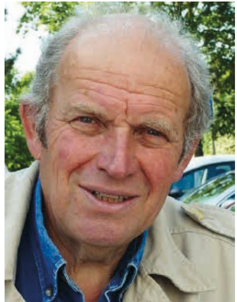
Seine Faszination war auf vielen Exkursionen ansteckend und inspirierend.

Seine Leidenschaft galt aber nicht dem „Spezialistentum“ sondern der Vermittlung von fundiertem Wissen zur Biologie der heimischen Tiere und auch der Charakteristika und Besonderheiten von Pflanzen am Wegesrand. Auf die vielfältigen Beziehungen zwischen Tieren und Pflanzen richtete sich seine Aufmerksamkeit. Ökologische Fragestellungen beschäftigten ihn besonders - so auch die Biologie der Süßwassermuscheln und ihrer Lebensräume.