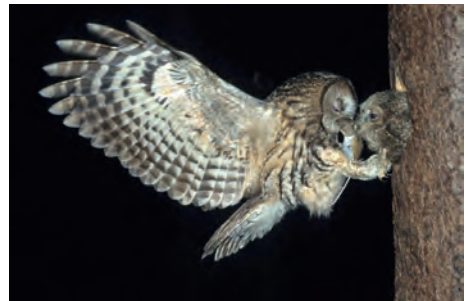
Das Männchen versorgt das Weibchen während der Brut.

Vorrangig jagt er Nagetiere wie Maulwürfe, Ratten, Jungkaninchen und vor allem Mäuse. Bis zu 300 g schwere Beutetiere kann der Waldkauz schlagen und trans-