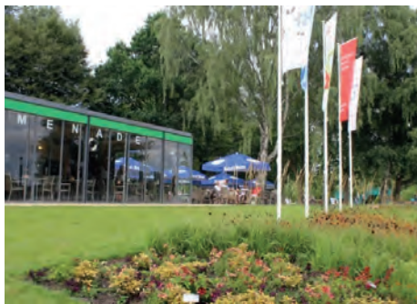
Baumarktflair statt Gartenkultur.

Einjährigen bepflanzten Blumenrabatten und -kübel, mal in Rot-, mal in Blau- oder Gelbtönen abgestimmt. Nur die Masse an Blüten, die grelle Intensität der Farben bestimmte deren Bild. Turnusgemäß waren die Frühjahrsblüher gegen die Sommerblumen ausgetauscht worden, die dann vermutlich der Herbstkollektion weichen mussten. So wurden Pflanzen zu massenhafter Wegwerf-Ware degradiert - mit der Begründung, im Gartenbau sei dies eben üblich. Der normale Lebenslauf einer Pflanze, geprägt durch Wachsen, Knospen, Blühen, Fruchten und Vergehen, war nicht vorgesehen, weil unansehnlich. Allein Üppigkeit war gefragt. Strukturvielfalt, diffizile Formen und Farben fristeten auf dieser Gartenschau allenfalls ein Nischendasein. Wer sich für besondere Stauden interessierte, suchte vergeblich. Immerhin war das vorhandene Sortiment mit Namensschildern versehen. Davon brauchten die Gartengestalter allerdings nicht allzu viele. Denn das Arten- und Sortenspektrum blieb kümmerlich; so mancher Hausgarten weist deutlich mehr Vielfalt auf.