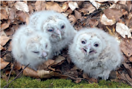
Die „Ästlinge“ bleiben in der Nähe des Nestes und werden von den Eltern weiter versorgt.

portieren. Vor allem in Siedlungsgebieten weicht er auf Vögel aus, angelt sogar Höhlenbrüter mit seinen langen Beinen durch das Flugloch heraus. Weiterhin gehören Frösche, Kröten, Insekten, Regenwürmer und gelegentlich kleinere Eulen, wie den Raufuß- oder den Sperlingskauz zum flexiblen Ausweichspeiseplan. Auch beim Fischen wurden die Waldkäuze schon gesehen. Die wendigen Ansitz- und geschickten Bodenjäger beginnen ihre Nahrungssuche 20 Minuten nach Sonnenuntergang. Kleinere Beute wird vollständig verschlungen, größere grob zerteilt. Aus den unverdaulichen Federn, Haaren und Knochen werden im Magen Gewölle geformt und wieder hervor gewürgt. Ist genug Beute vorhanden, versteckt der Waldkauz Reserven in Höhlen, auf Balken oder ähnlichen Verstecken.