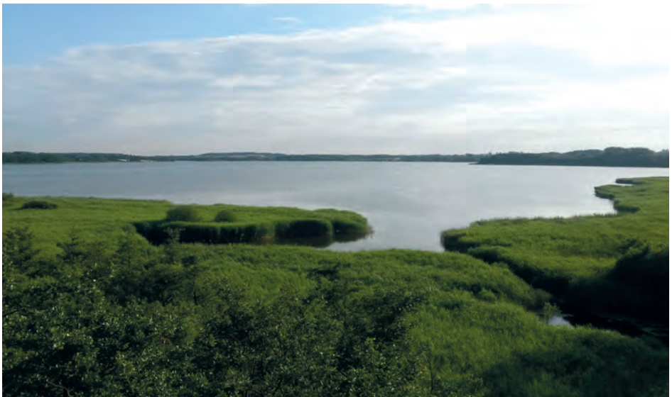
Den Ausblick vom Hermann-Löns-Turm sollte man sich nicht entgehen lassen.

Das Gebiet wartet aber mit einer weiteren Besonderheit auf. So lassen sich hier fast nebeneinander alle drei heimischen Schwirlarten beobachten. Schwirle sind kleine unscheinbar braun gefärbte Singvögel, die sich ähnlich wie Rohrsänger geschickt zwischen Halmen hochwüchsiger Vegetation bewegen. Der namensgebende schwirrende Gesang ist für diese Artengruppe charakteristisch.