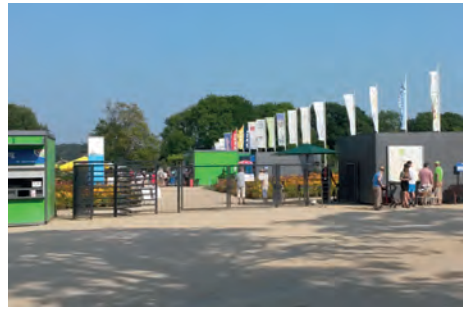
Haupteingang mit dem Charme eines Gewerbegebiets.

Genauso überzogen wurden die „Gärten der Erinnerung“ als „Höhepunkt“ verkauft, um sich dann dem Besucher als Musterkollektion von Grabstätten zu entpuppen. Für ländliches Flair sollten neben einer öden „Landwiese“ ein paar Hühner, Schafe und Ferkel sorgen - für Kinder ganz nett, aber ebenso wenig als „Höhepunkt“ einer Landesgartenschau geeignet. Dazu ein paar Spielflächen, eine Veranstaltungsbühne, Blumenausstellungen in den Gebäuden des historischen Betriebsshofs - alles ohne wirklichen Reiz und ohne erkennbares Kon-