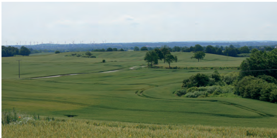
Die Landschaft um den Bungsberg soll vor einer weiteren „Verspargelung“ geschützt werden.

Offenbar wirken hier neben dem üblicherweise zu beobachtenden Grundreflex, sich gegen verwaltungsseitige Maßnahmen zum Schutz von Natur- und Landschaft zu wehren, die mit dem Ausbau der Windenergie verbundenen Rendite-Aussichten.