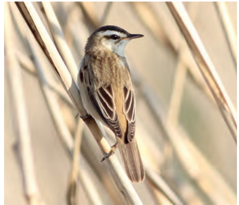
In den Schilfbeständen des Hemmeldorfer Sees brütet der Schilfrohrsänger.

Das Highlight eines jeden Besuchs im Gebiet ist zweifellos der unvergessliche Ausblick vom „Hermann-Löns-Turm“ am Nordufer des Hemmeldorfer Sees, den man sich auf keinen Fall entgehen lassen sollte. Von dort hat man einen herrlichen Blick über den See. Von hier lassen sich jagende Seeadler ebenso gut beobachten, wie der Anflug der Kormorane zu ihrem Winterschlafplatz am Nordwestufer – bis zu 4.000 der schwarzen Fischfresser besuchen diesen Platz jeden Abend. Ein Besuch Ende April beschert dem Beobachter oftmals eine große Anzahl rastender Zwergmöwen, die auf ihrem Weg in die russischen Brutgebiete hier Station machen. Mehrere Tausend dieser graziilen Möwen lassen sich am Hemmeldorfer See beobachten. Unterhalb des Aussichtsturms flitzt regelmäßig der Eisvogel entlang.