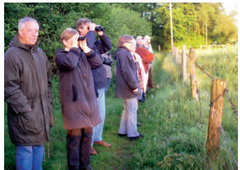
Auf der Exkursionen gibt es immer etwas zu entdecken.

Die Teilnahme ist für Mitglieder kostenfrei, Erwachsene zahlen 2 €, Kinder 1 €