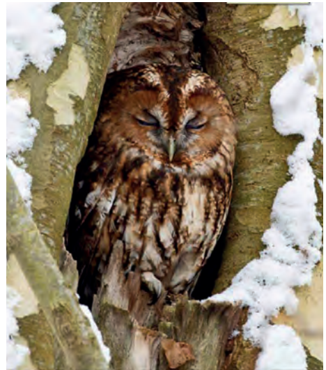
Der Waldkauz ist durch sein Gefieder gut getarnt und besser über seinen Ruf wahrnehmbar.

Spezielle Schalldämpfer aus besonders dichten und samtigen Polstern auf der Oberseite der Flügel und kammartige Zähnnchen an den Flügelkanten verwirbeln den Luftstrom beim Fliegen und sorgen dafür, dass er seine Beute nahezu geräuschlos anfliegen kann.