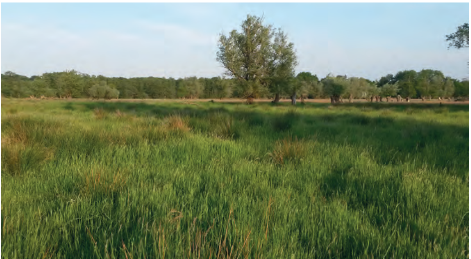
Halboffene Grünländer: Idealer Lebensraum für den Neuntöter.

In den breiten Schilfbeständen am Ufer des Hemmelsdorfer Sees lassen sich ornithologische Leckerbissen wie Drosselrohrsänger, Bartmeise oder Schilfrohrsänger beobachten. In den angrenzenden Bruchwäldern fühlen sich Pirol, Kranich und Mittelspecht wohl. Die Weideflächen und Feuchtwiesen bieten dem Neuntöter gute Lebensbedingungen. Mit viel Glück lässt sich bei einem abendlichen oder frühmorgendlichen Be-