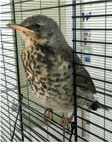
Die junge Wacholderdrossel hat sich gut entwickelt und wartet auf die Auswilderung.

Vogelstation in der Nähe hatte keine freien Kapazitäten mehr, da zu dieser Zeit viele Jungschwäne dort in Betreuung waren. Wir hätten somit die Kleinen entweder draußen sterben lassen oder uns selbst um die Betreuung kümmern müssen. Also haben wir die Schwalben mit ins Haus genommen und sie per Hand aufgezogen. Drei Schwalben konnten wir später auswildern. Sie wurden von der hier lebenden Schwalbenkolonie aufgenommen.