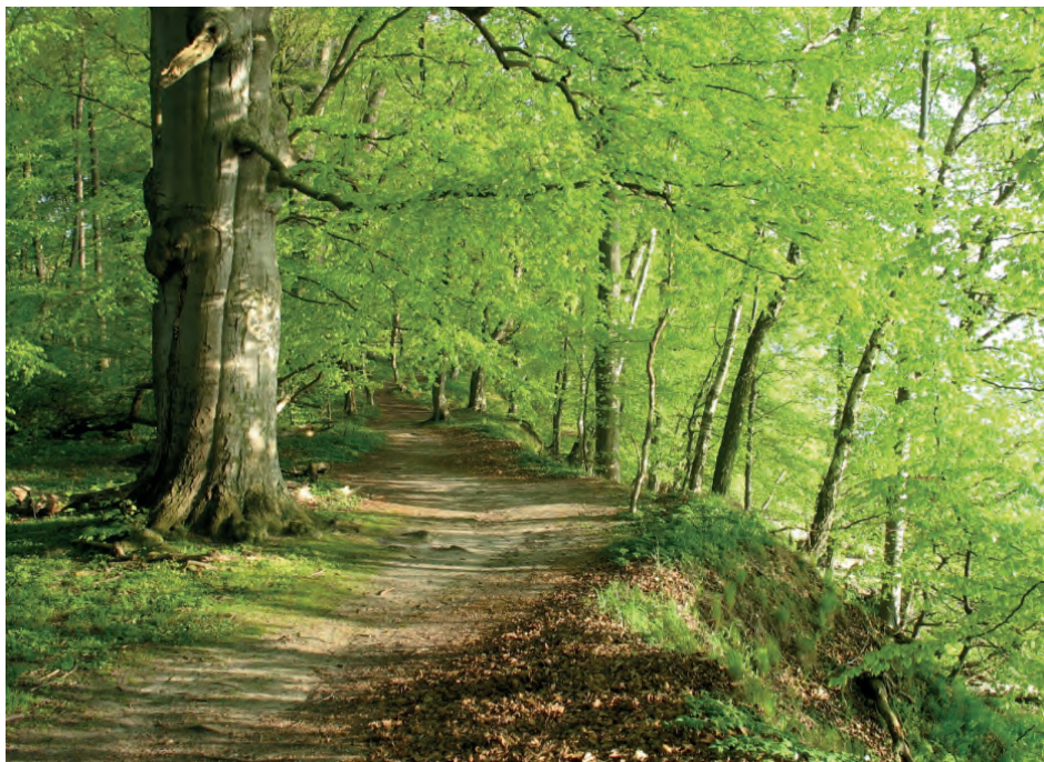
Alte Laubwälder mit Höhlenbäumen, Lichtungen, Waldrändern und angrenzenden Feldern werden vom Waldkauz bevorzugt.

Weltweit gibt es damit etwa 700.000 bis 1,2 Millionen Brutpaare, davon in Europa ca. 530.000 bis 940.000 Brutpaare. Deutschland hat mit etwa 8-9 Prozent des europäischen Bestandes eine besondere Verantwortung für die Art. In dicht besiedelten Bereichen finden sich über 50 Reviere aus 100 m 2 . Der Bestand in Deutschland bleibt nach vorherigem starkem Rückgang seit 1997 weitgehend konstant.