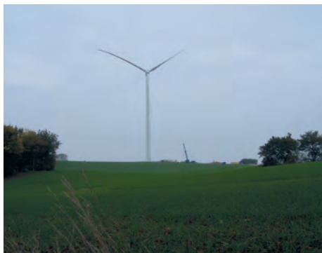
Die Anlagen überragen selbst die Lübecker Marienkirche.

Eine zum Zweck des Baus und Betriebs von Windenergieanlagen gegründete Betriebsgesellschaft plante die Errichtung von fünf bis zu 150 m hohen modernen „Windmühlen“ in der kuperten Landschaft zwischen Halendorf und Kniphagen.