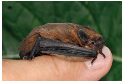
Die heimische kleinste Fledermaus, die Mückenfledermaus, ist noch etwas kleiner als diese Zwergfledermaus.

Wer an Fledermausschutz in Schleswig-Holstein interessiert ist, kann unter anderem einmal auf die Internetseite www.Fledermausschutz-SH.de schauen, einen lohnenswerten Besuch im Fledermauszentrum am Kalkberg in Bad Segeberg machen oder den NABU Eutin kontaktieren. Auch die Wälder der Umgebung Eutin haben da einiges zu bieten.