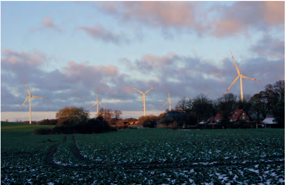
Die neuen „Windmühlen“ schrumpfen die Landschaft und sind immer wahrnehmbar.

In tiefer Nacht, wenn keine AutoGeräusche mehr zu vernehmen waren, konnte man früher auch weiter entfernt singende Nachtigallen hören oder die Teichfrösche quakten vom Gut herüber - vorbei ! Natürliche Geräusche treten in den Hintergrund