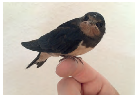
Auch diese junge Rauchschwalbe ist schon fit für den Flug in den Süden.

Definitiv ja. Gerade bei den Vogelkindern, die mitunter alle halbe Stunde gefüttert werden müssen. Diese Anstrengung ist jedoch schnell wieder vergessen, da man die faszinierende Entwicklung der Tiere sehr intensiv mitbekommt. Wenn die Tiere dann unser Haus verlassen und in die Natur entschwinden, sind wir natürlich einerseits sehr traurig, da uns unsere Zöglinge sehr