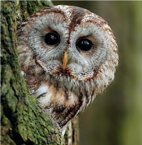
Durch sein Gesichtsschleier kann der Waldkauz Geräusche präzise wahrnehmen.

Seine feinen Sinne nehmen auch die leisensten Geräusche bis zu 100 m weit wahr. Die Trichterwirkung des Gesichtsschleiers leitet Geräusche schallverstärkt an die unter Federn versteckten, asymmetrisch angeordneten Ohren weiter. Waldkäuse verlassen sich bei völliger Dunkelheit ausschließlich auf ihr Gehör. Dabei kann er mit seinen schwarzen Knopfaugen tags- und nachtsüber – außer bei völliger Finsternis - ausgezeichnet sehen. Ihre großen Augen nehmen besonders viel Licht auf, das die Iris perfekt regulieren kann. Eulenaugen sind nach vorne gerichtet und ermöglichen ein räumliches Sehen und damit ein besseres Einschätzen von Entfernungen.