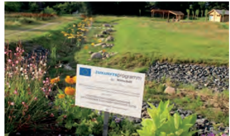
Plastikblumen verzieren den offen angelegten Regenwasserkanal mit Steinschüttung.